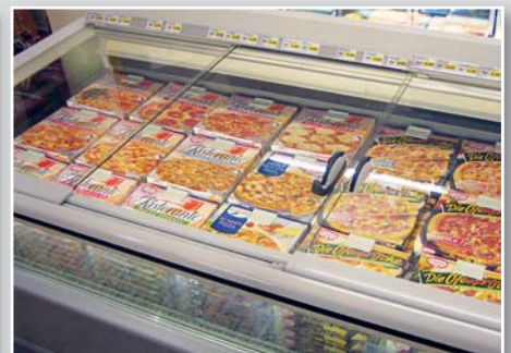
Wann fällt man nicht mehr fast in die Tiefkühltruhe, weil man nach der letzten Pizza fischen muss?

finden oder schlimmstenfalls gar nicht? Wann fällt man nicht mehr fast in die Tiefkühltruhe, wenn man nach der letzten Pizza fischen will?