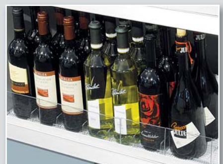
Wann muss ich nicht erst die Weinflaschen sortieren, um meinen Lieblingswein irgendwo ganz hinten im Regal zu finden oder schlimmstenfalls gar nicht?