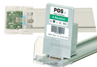
Mit Sensoren ausgestattete Warenvorschübe erkennen Warenzugriffe.

Selbst wenn in zahlreichen Fällen laut Warenwirtschaft Bestände vorhanden sind, stehen diese oftmals nicht im Regal. Bei genauerer Betrachtung scheint es, dass die Ware die letzten Meter von der Warenannahme der Filiale nicht mehr bis ins Regal schafft.