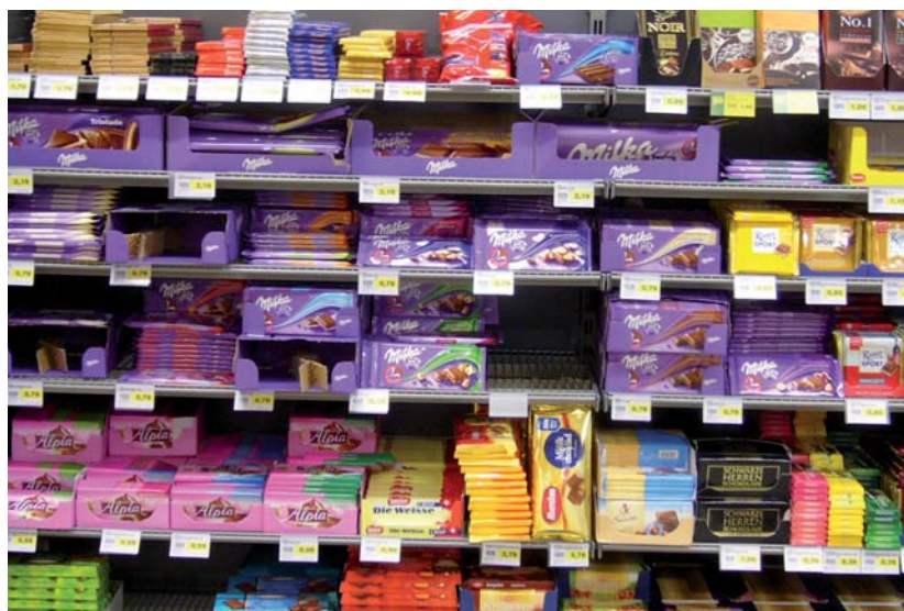
Die Nichtverfügbarkeit von Artikeln führt für den Shopper zu Einkaufsstress. Die Gefahr einer Abwanderung zu einer anderen Einkaufsstätte oder zu einem anderen Produkt ist groß.

Die aufgeführten Beispiele und aktuelle Studien zeigen, dass Handel und Industrie durch CM-Aktivitäten bereits Erfolge erzielen, aber insbesondere in Bezug auf CM-/ Shopper-basierter Umsetzung am POS noch erheblicher Optimierungsbedarf besteht. Händler und Hersteller, die dieses Potenzial für sich erschließen, gewinnen Wettbewerbsvorteile. Der Shopper honoriert, wenn er am POS begeistert wird. Er wird zu einem Fan ... ♦ Udo Voßhenrich